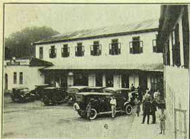
O Patronato de Menores, onde foram recolhidos varios feridos.