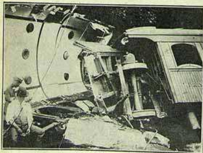
Como ficaram os carros da composição

A composição descia a serra a principio com lentidão, sustentando os dois carros a locomotiva 22 que parecia funcionar rigorosamente. E sem que nada fizesse prevêr a catastrophe que cortaria tão tragicamente a vida de muitos dos que viajavam nos dois carros, a composição chegou a estação de Soberbo.