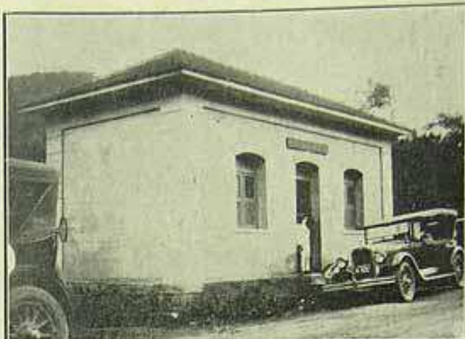
A estação de Soberbo, a mais proxima do local do desastre.