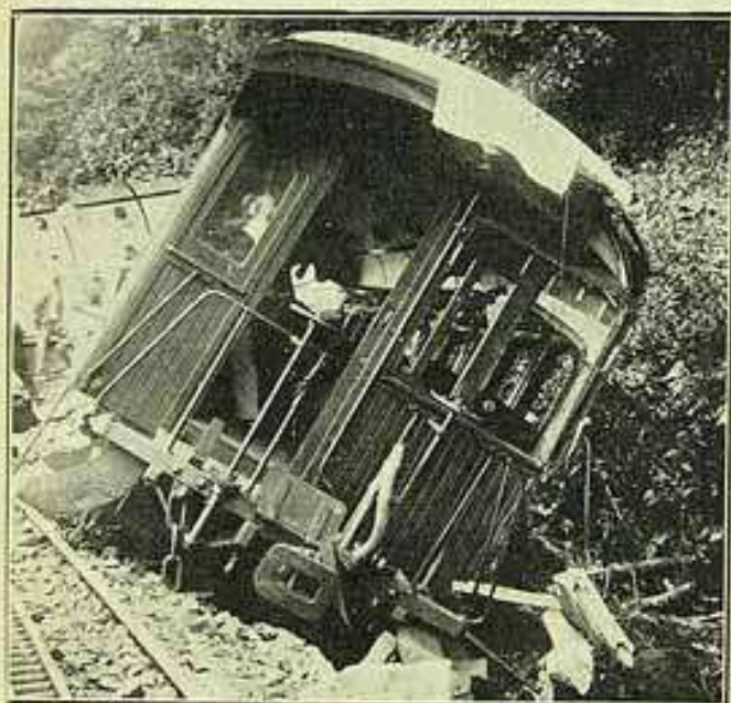
O ultimo carro da composição atirado fóra das linhas pelo choque.