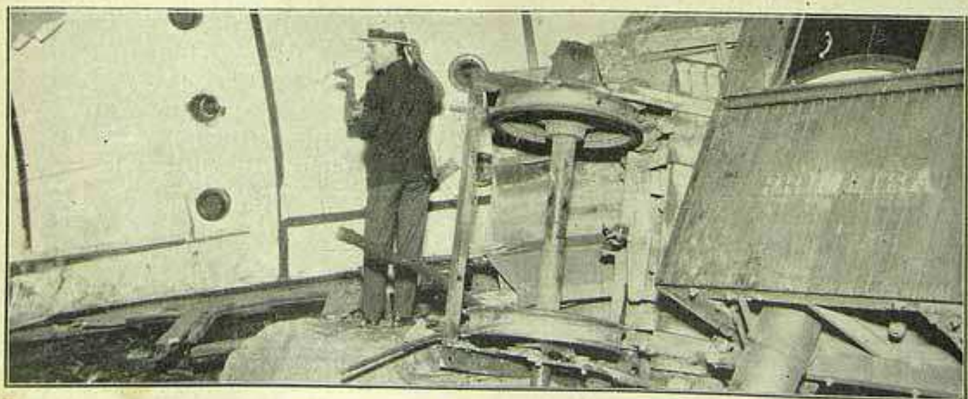
O primeiro carro da composição em completa ruina