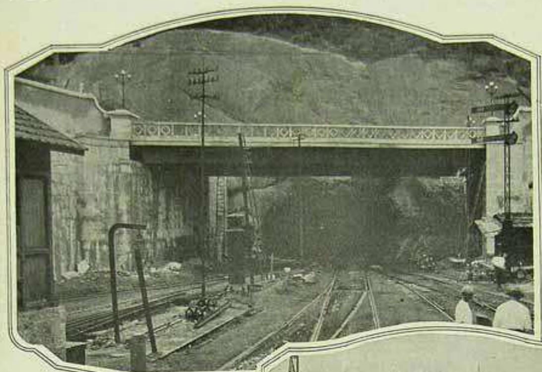
Passagem superior para vehiculos em substituição á passagem do nível da rua da Gambôa (Projecto do Escriptorio Technico, do Engenheiro Emilio Baumgart).