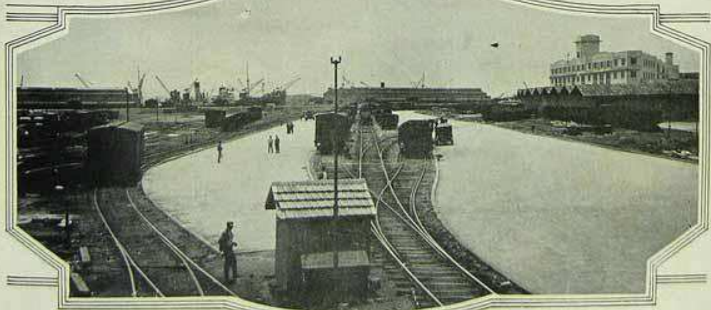
Local da antiga esplanada, depois de executados os grandes melhoramentos, hoje Avenida Rei Alberto