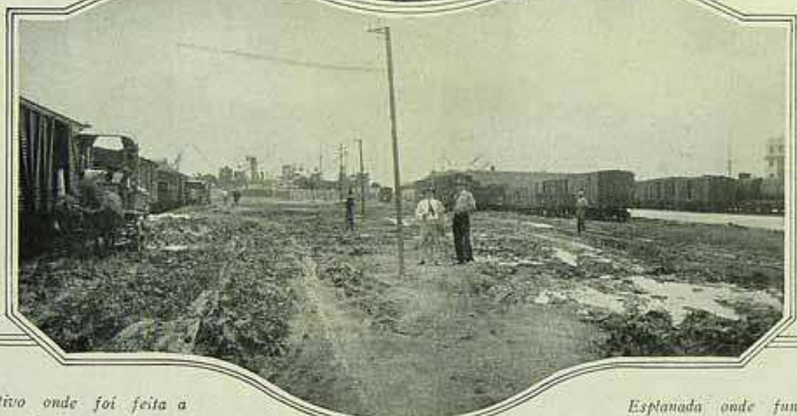
Local primitivo onde foi feita a esplanada para localização do pátio da Maritima.